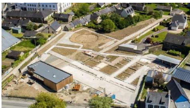
Carhaix Poher tourisme - Point d'accueil des nouveaux arrivants en Poher communauté

Rue du Docteur Menguy 29270 CARHAIX 02 98 17 53 07 - tourismecarhaix@poher.bzh